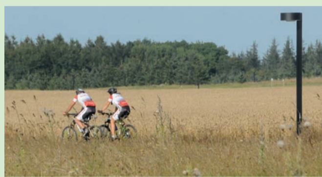
Stizonen, Kildebjerg Ry